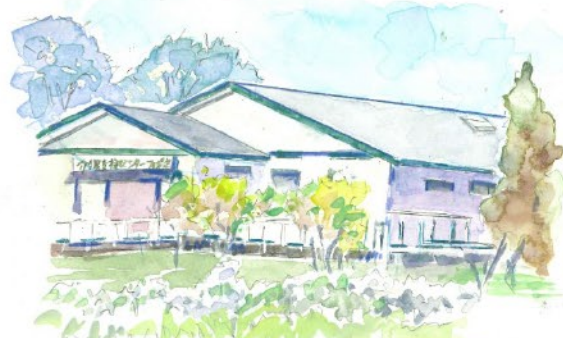
介護支援センターつばさ グループホーム事業部