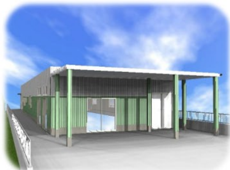
ケアプランセンターつばさ 介護支援センターつばさデイサービス事業部