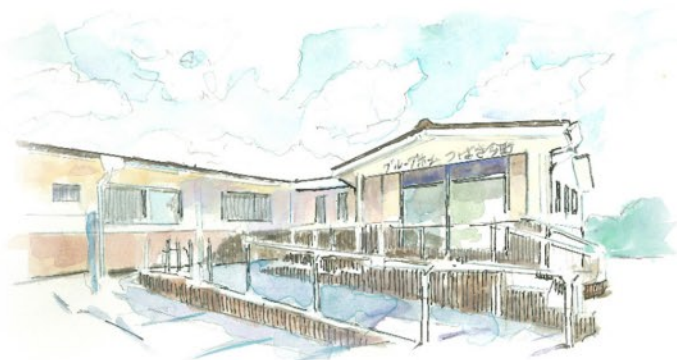
グループホームつばさ今町