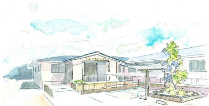
グループホームつばさ吉原 認知症デイサービス吉原